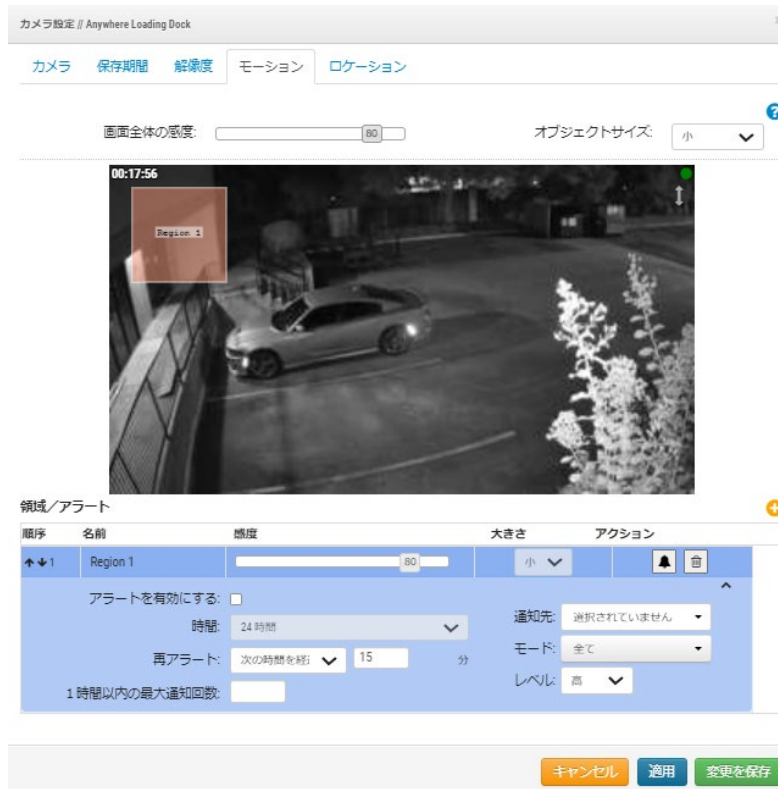
図3：「カメラ設定」の「モーション」タブ、もしくはベル型アイコンでイベントのアラート設定を開いた例