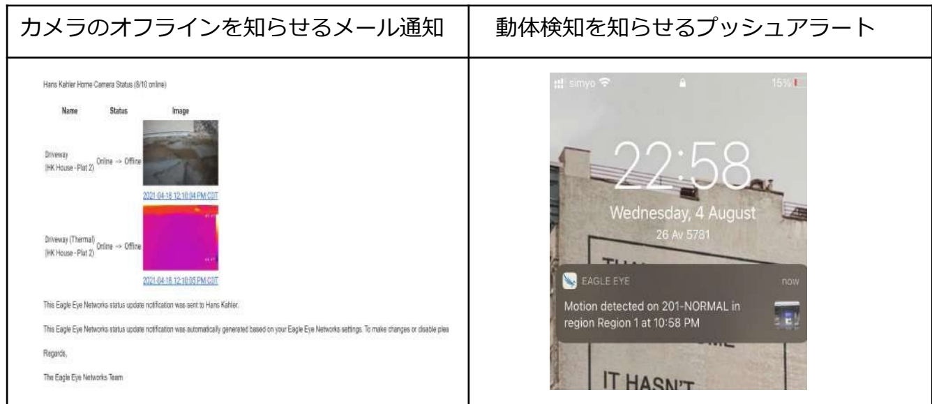
表1: 通知の画像（左）とイベントベースのアラート（右）の例